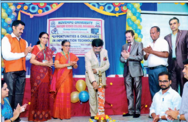
Computer National Level Conference Inauguration