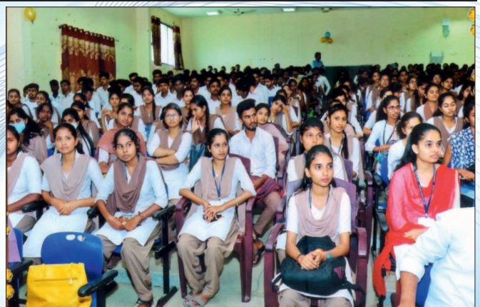
Placement Cell Activities