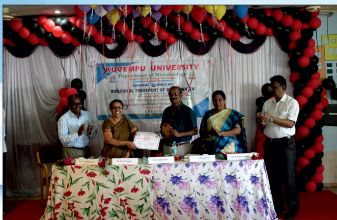
Special Lecturer on Biological treatment o Waste Water