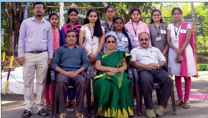
2021ರ ಗಣರಾಜ್ಯೋತ್ಸವ ದಿನಾಚರಣೆಯಲ್ಲಿ ರೆಡ್ ಕಾಪ್ ಸದಸ್ಯರು