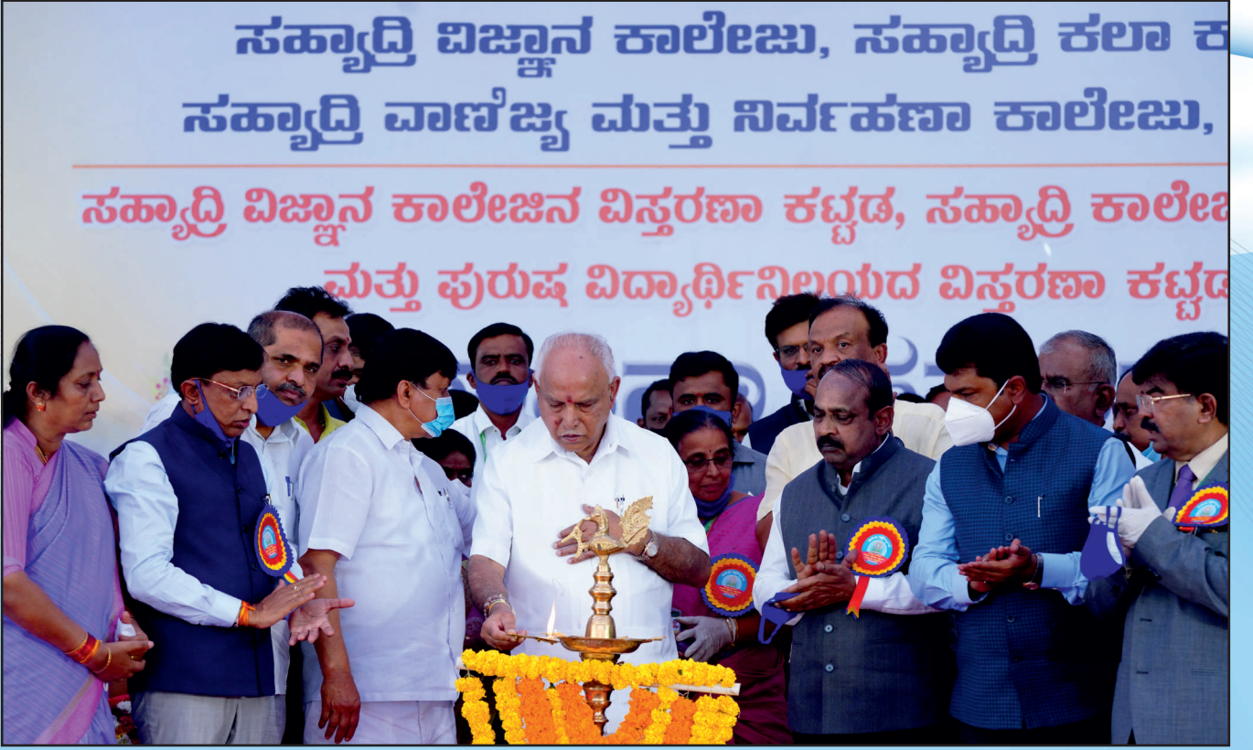
ಸಹ್ಯಾದ್ರಿ ವಿಜ್ಞಾನ ಕಾಲೇಜಿನ ವಿಸ್ತರಣಾ ಕಟ್ಟಡ ಉದ್ಘಾಟನಾ ಸಮಾರಂಭ