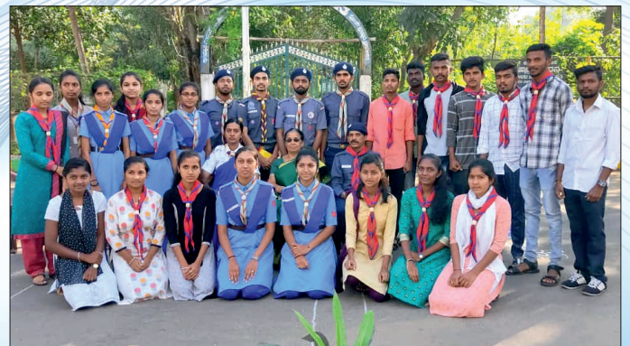
75ನೇ ವರ್ಷದ ಸ್ವಾತಂತ್ರ್ಯೋತ್ಸವ ದಿನಾಚರಣೆಯಲ್ಲಿ ರೋವರ್ಸ್-ರೇಂಜರ್ಸ್ ಸದಸ್ಯರು