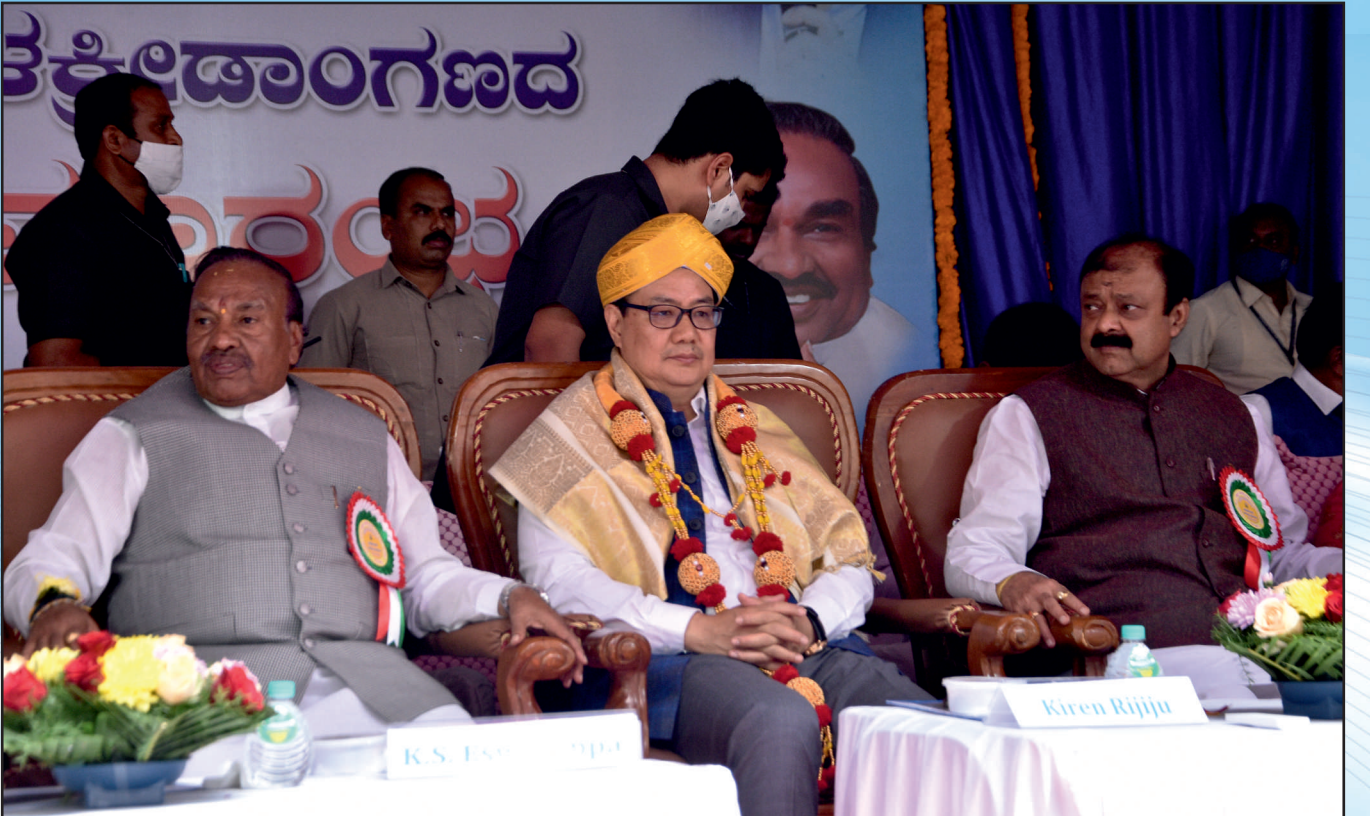
ಸಹ್ಯಾದ್ರಿ ಕಾಲೇಜಿನ ಒಳಕ್ರೀಡಾಂಗಣದ ಶಿಲಾನ್ಯಾಸ ಸಮಾರಂಭ