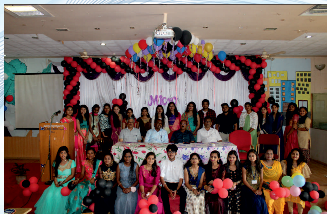
Student Participation in Special Lecturer programme