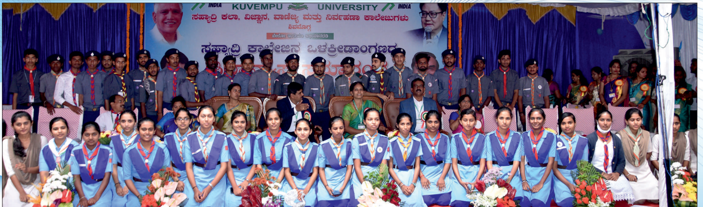
ಸಹ್ಯಾದ್ರಿ ಕಾಲೇಜಿನ ಒಳಕ್ರೀಡಾಂಗಣದ ಶಿಲಾನ್ಯಾಸ ಸಮಾರಂಭದಲ್ಲಿ ರೇಂಜರ್ಸ್ - ರೋವರ್ಸ್ ವಿದ್ಯಾರ್ಥಿಗಳು